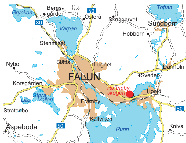
Falu kommun/Mät och karta