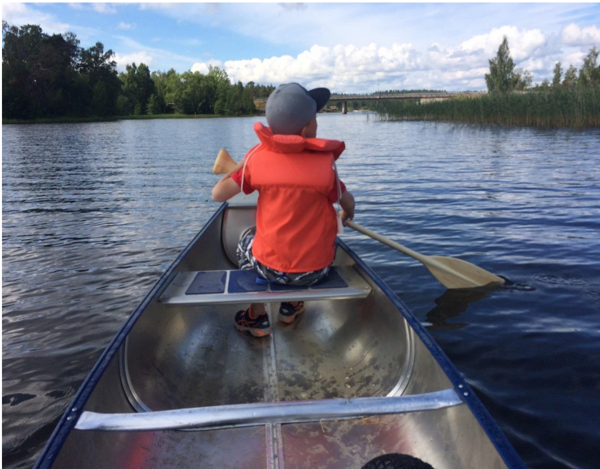
Foto från en privatperson på Vikasjön i en av de inköpta kanoterna.

Fyra aluminiumkanoter av märket Linder har köpts in med tillhörande paddlar, kedjor, godkända lås, flytvästar och kanotvagnar. Dessutom har de totalrenoverat en gammal byggnad till ett kanotförråd med förvaring för all utrustning. Kanoterna som är inlåsta 75 meter från Vikasjön används i scouternas verksamhet, hajker och kan kvitteras ut av allmänheten som vill ta en tur på Vikasjön av Vika Scoutkår.