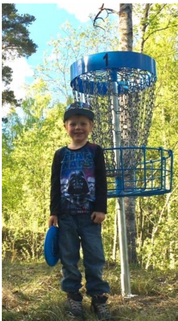
Bild på en ung discgolfare

Vika IF har tillsammans med många ideella krafter och åtskilliga timmar byggt upp en 18-håls discgolfbana. Banan följer naturlig och kuperad terräng längs med det ca 2,5 km långa elljusspåret. Den har blivit väldigt populär och nyttjas av gammal som ung. Kastning pågår året runt med många besökare från Åsbobanans vänner i Falun och Fb-gruppen i Vika som heter Vika Discgolfers.