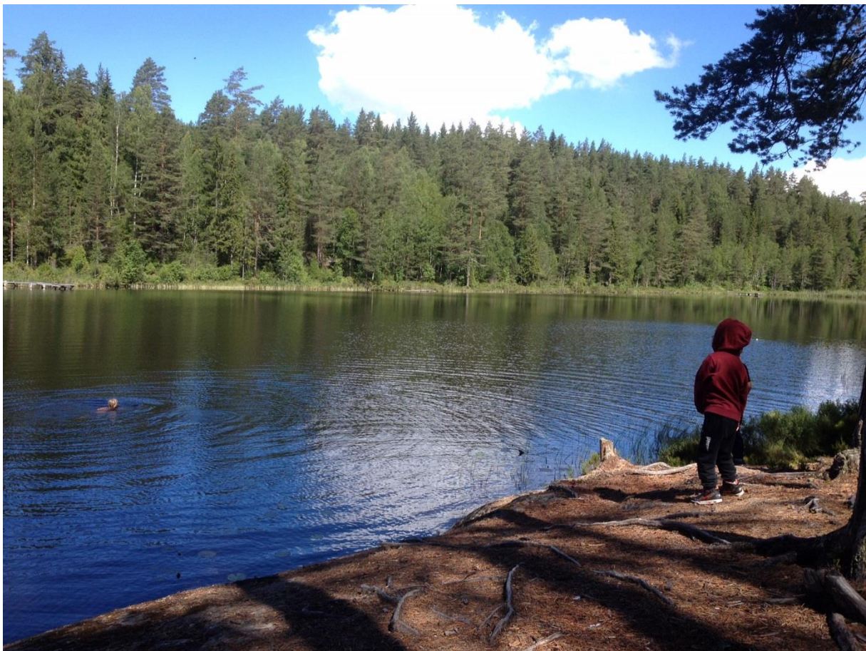
Bild från en av Sportfiskeklubbens platser vid Långtjärn

Tack vare KDU-medlet 2017 har Sportfiskeklubben kunnat köpa in en båt för underhåll och i livräddningssyfte vid Långtjärn. Dessutom har de köpt in fem st. bänkbord till sin nya grillplats som öppnar våren 2018 vid Sågsjön i Såghyttan.