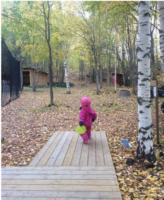
Bild på första tee med nätet på vänster sida

Vika IF har använt pengarna till att istället för staket sätta upp ett stort nät i säkerhetsyfte mot discgolfbanan, lagt nytt spån och tryckt upp skyltar som marknadsföring för anläggningen.